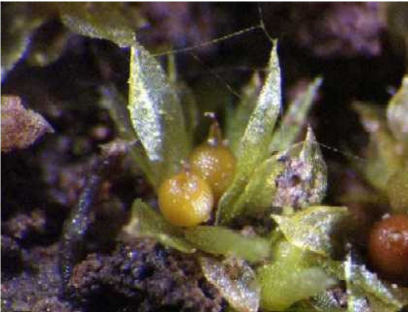
Abb. 2: Physcomitrella patens.