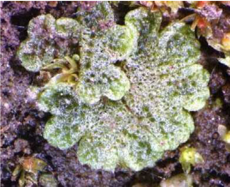
Abb. 1: Riccia cavernosa.